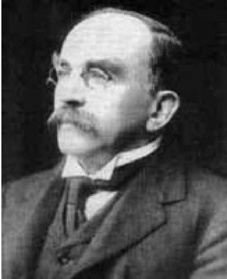
Joseph Larmor (1857 - 1942)

Em 1897, o físico norte-irlandês Joseph Larmor publicou as transformações de Lorentz na conceituada revista científica inglesa Philosophical Transactions of the Royal Society in 1897. Note que isso ocorreu dois anos antes de Hendrik Lorentz e oito anos antes de Albert Einstein. Larmor também foi capaz de prever o fenômeno da dilatação do tempo e também a contração do espaço.