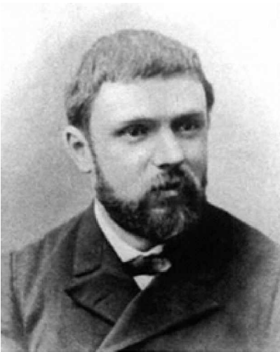
Jules Henri Poincaré (1854-1912)

Finalmente Lorentz escreveu por extenso as transformações que agora têm o seu nome, sendo portanto a terceira pessoa a fazê-lo. Ele então, assim como Larmor já havia feito, mostrou que a contração de FitzGerald-Lorentz era uma consequência dessas transformações.