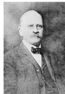
Edward Williams Morley (1838 - 1923)

Michelson foi persuadido por Thomson e outros a repetir sua experiência. Ele assim o fez em 1887, dessa vez associando-se ao físico norte-americano Edward Williams Morley. Os dois cientistas registraram, mais uma vez, que nenhum efeito de arrasto havia sido encontrado. Parecia que a velocidade da luz era independente da velocidade do observador. Michelson e Morley refinaram a experiência e a repetiram várias vezes até 1929.