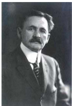
Albert A. Michelson (1852 - 1931)

Impelido pelas idéias de Maxwell, o físico Albert Abraham Michelson (nascido na Prússia e naturalizado norte-americano) iniciou uma série de experiências sobre o éter. Em 1881, ele registrou: